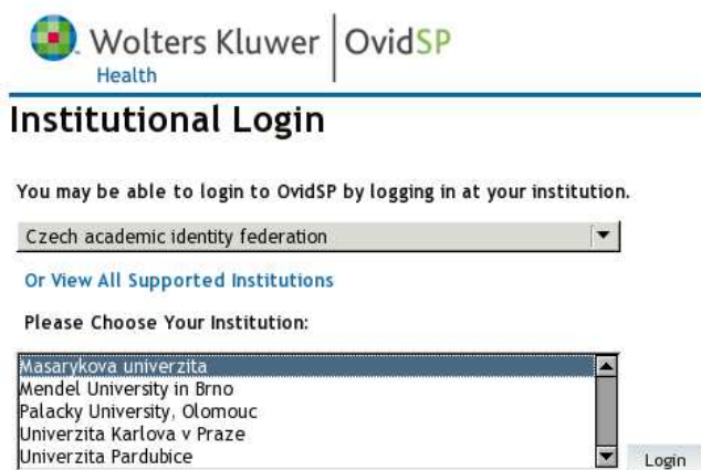
Obrázek 3: Výběr federace a instituce u OVID SP

znam institucí, které patří pod zadanou federaci, a uživatel z něj vybere svou mateřskou instituci (Masarykova univerzita). Následně je již přesměrován na stránky instituce, kde pokračuje přihlášením popsáním v předešlém odstavci.